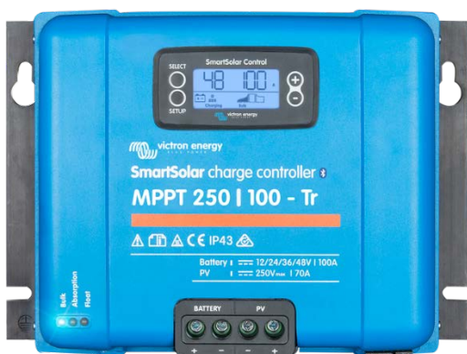
Contrôleur de charge SmartSolar MPPT 250/100-Tr avec un écran enfichable