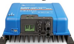
Contrôleur de charge solaire MPPT 150/70 MC4