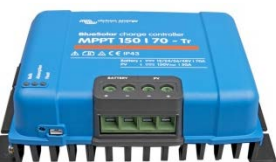
Contrôleur de charge solaire MPPT 150/70-Tr