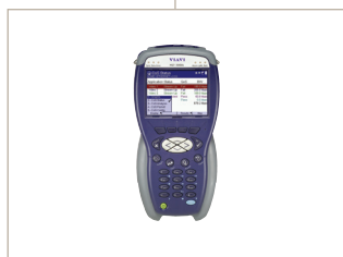
Soluciones de acceso