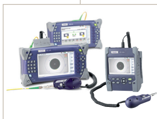
Soluciones de pruebas de fibra