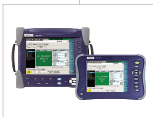
Soluciones de pruebas Metro