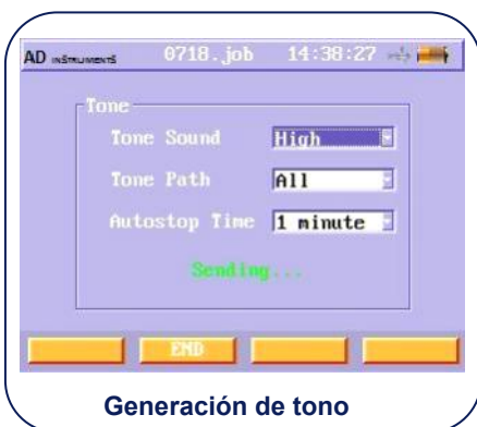
Generación de tono