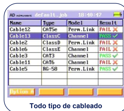
Todo tipo de cableado