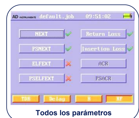
Todos los parámetros