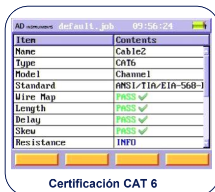
Certificación CAT 6