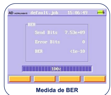
Medida de BER