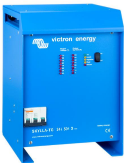
Skylla TG 24 50 3 phase

Para saberlo todo sobre las baterías, las configuraciones posibles y ejemplos de sistemas completos, pida nuestro libro gratuito "Energía Sin Límites" también disponible en www.victronenergy.com