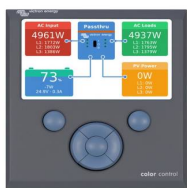
Color Control GX