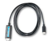
VE.Direct to USB interface