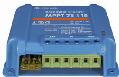
Controlador de carga solar MPPT 75/15