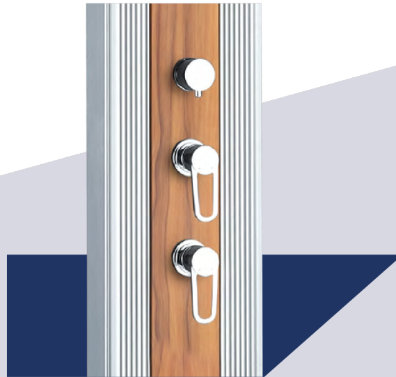
Ducha caliente / fría para un uso preciso.

La rueda superior le permite elegir entre el cabezal de la ducha o la ducha de mano integrada