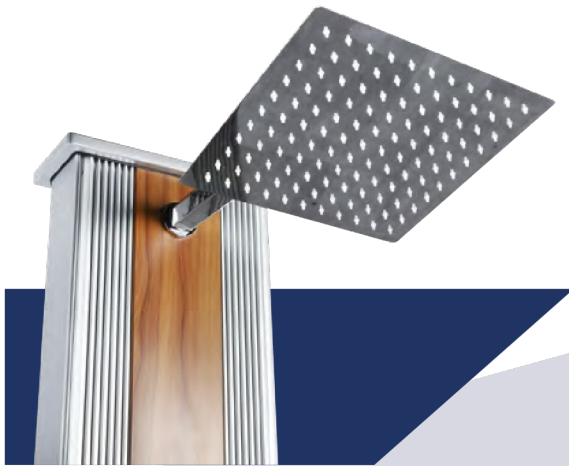
Rociador de ducha anti-cal integrado